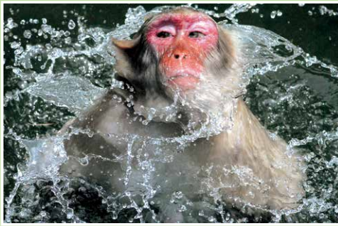
【準グランプリ】大戸俊郎《ウォーターモンキー2》