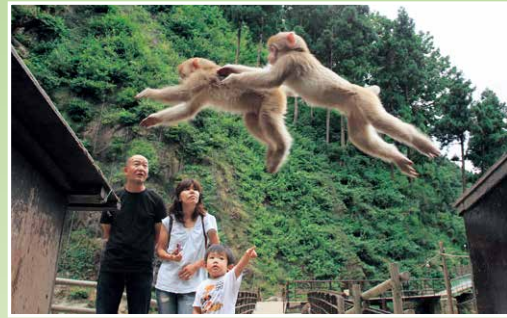
【準グランプリ】青木彦忠《ジャンプ》