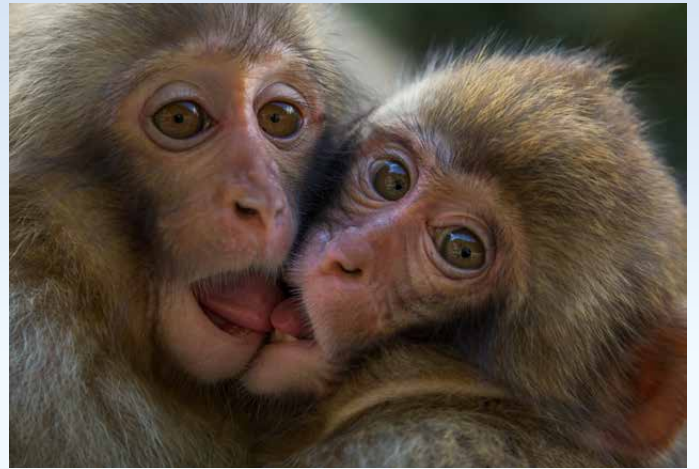
【準グランプリ】萩麗敏《仲よし》