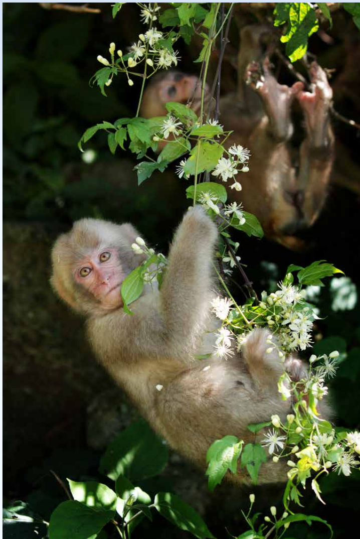
【スノーモンキーフォトコンテスト Vol.4 グランプリ】増田恵美子《花のブランコ》