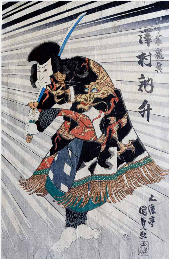
歌川国貞 Utagawa Kunisada 《斎藤龍興 沢村勲升》19世紀 (一財) 和合会 蔵