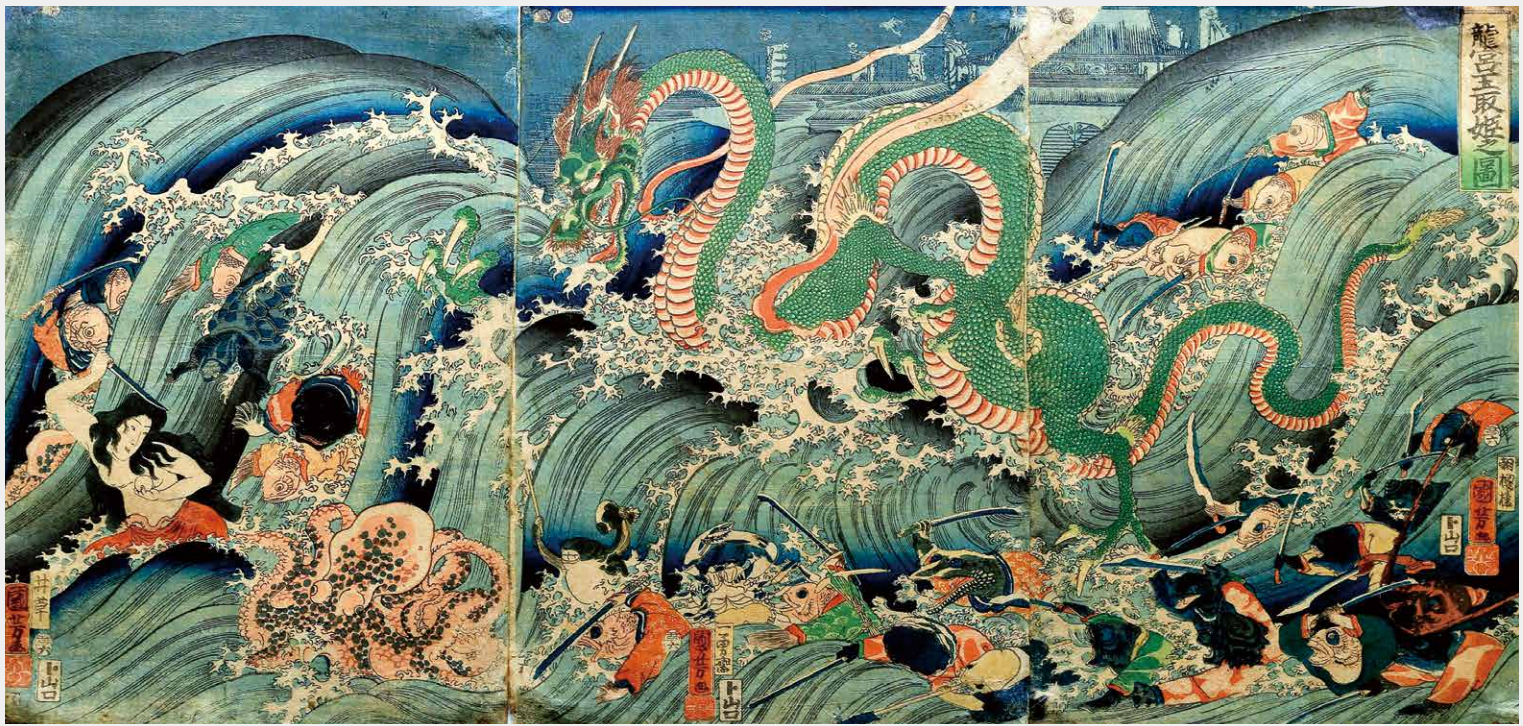
歌川国芳 Utagawa Kuniyoshi 《龍宮玉取姫之図》1853 (嘉永6) 年 志賀高原ロマン美術館 蔵