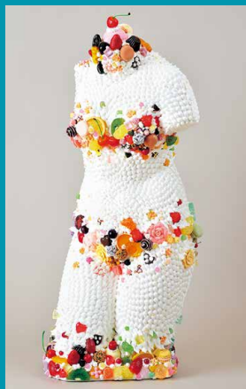
渡辺おさむ《お菓子のトルソ》、 2010年、85×36×20cm