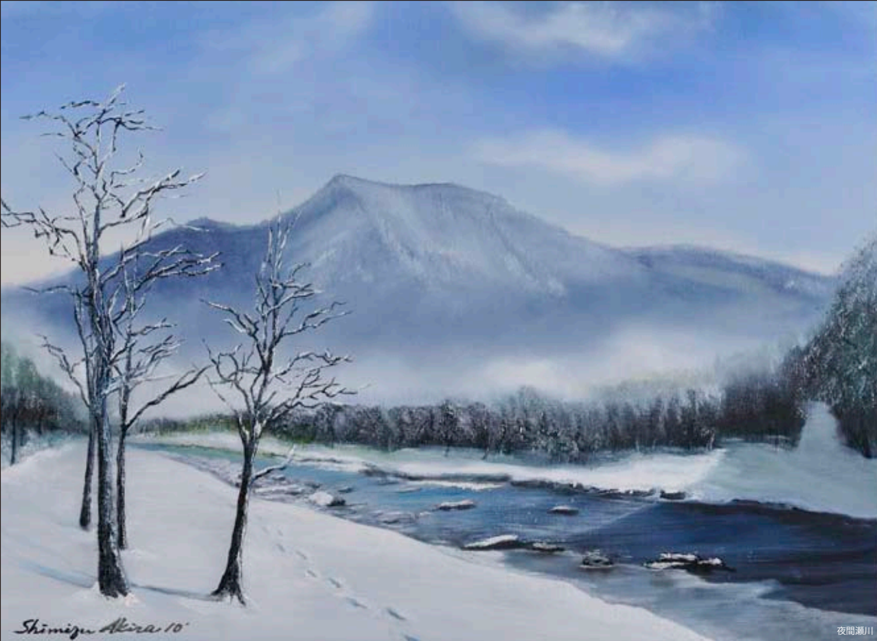
Shimizu Akira 10'